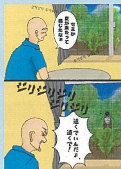
1頁漫畫【高中組】(Distance・距離) 作品名:夏天的距離感 筆名:NATATEKOKO