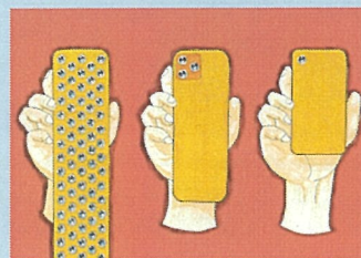
1頁漫畫【一般組】(成果·距離) 作品名:智能手機的終結 筆名:KOUTA的頻道