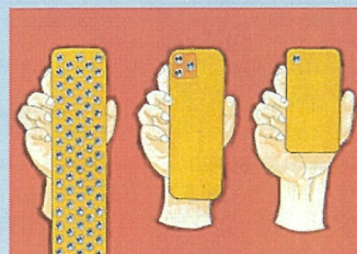
1頁漫畫【一般組】(成果・距離) 作品名:智能手機的終結 筆名:KOUTA的頻道