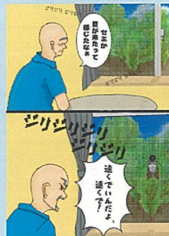
1頁漫畫【高中組】(Distance·距離) 作品名:夏天的距離感 筆名:NATATEKOKO