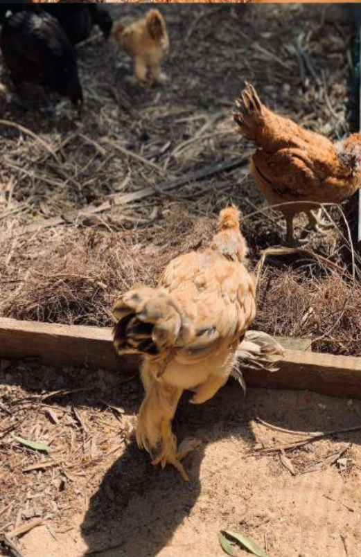
◀ 在養雞場到處散步的雞隻們。

除了與來自台灣的朋友合作，團隊更積極地朝在地推廣，將空間作為食農教育與長照共餐的戶外基地。他們認為與大人相比，小孩子的接受度跟好奇心會比較高，因此決定與國小合作，邀請當地長輩帶領小孩子來分享幼時的回憶，用窯、灶及島上的食材，製作蔥油餅和麵食，傳承島嶼飲食文化和生活經驗，重現馬祖居民移居台灣時賣蔥油餅的謀生手藝。學校的老師也非常支持團隊做這件事，希望讓孩子們瞭解東莒在地文化，他們在正泰養雞場也可以看到植物從土裡長出來、小雞從蛋裡孵出來到長大的過程，成為一個體驗生活、瞭解自然的空間。