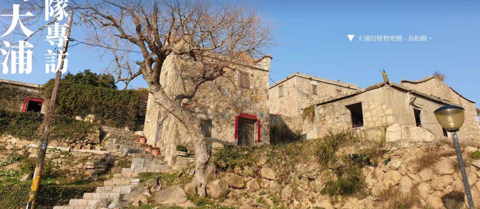
▼ 大浦的植物地標 - 烏柏樹。

當初縣政府文化處利用中央政府文資局給的補助經費，重修了七間老屋作為大浦計畫運作的基地。過去大浦計畫一直侷限在這七間老屋，直到去年縣政府產發處，提供了一筆經費讓團隊能夠進行活化改造，前提是空間必須提供做為公共用途。當時正泰養雞場所有權人的家族跟團隊是很好的鄰居，因為那裡閒置了多年，與地主討論之後，決定協助爭取經費去做硬體的整建，並與計畫結合。