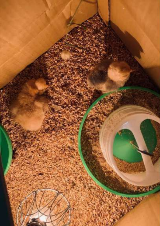
◀ 最初養在紙箱中的小雞。