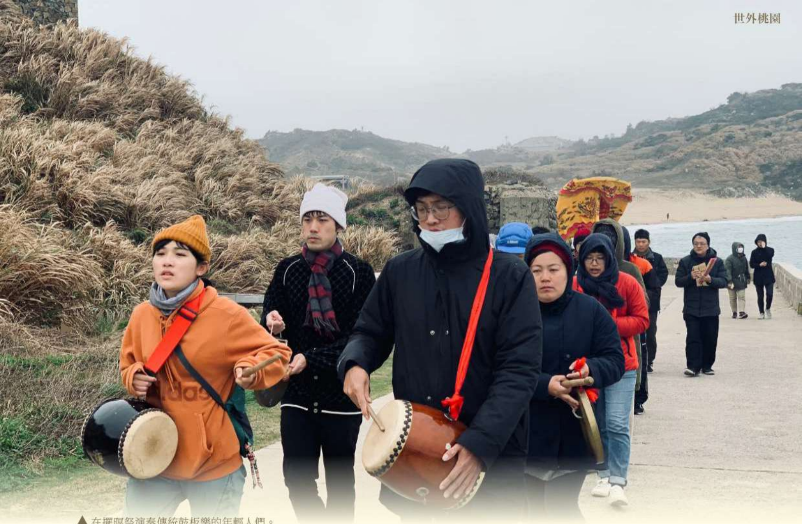
▲ 在擺暝祭演奏傳統鼓板樂的年輕人們。