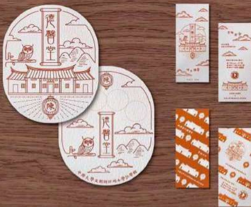
▲融合老屋造型語彙的文創商品。

人與人之間的連結是服務中最讓人印象深刻的經歷，雖然不全是美麗的相遇，但也讓學生們在服務的過程中收穫了許多人情世故，獲得難能可貴的友誼。