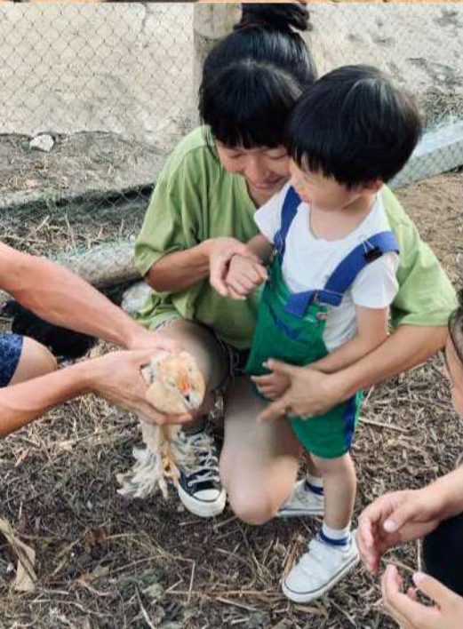
▼ (左) 第一次跟雞隻見面的小孩子。(右) 與東莒國小師生一同種下烏柏樹。

正泰養雞場重新開幕的那天，團隊與東莒國小的師生共同種下了一顆「烏柏(ㄩ-ㄨㄚˋ)樹」，烏柏樹是島上常見的原生樹種，也是大浦聚落最顯著的植物地標，觀光客去旅遊都會與之拍照。泳翰解釋這種樹四季都有不同面貌，夏天的時候枝繁葉茂，可以遮蔭；冬天時會落葉，太陽剛好可以照進去養雞場，給予雞隻溫暖，在各方考量後，烏柏樹真的是不二人選。一棵樹要長大需要 10 至 20 多年的等待，團隊期望它可以與孩子們一同成長茁壯，讓東莒未來如同夏天的枝葉活力滿滿。