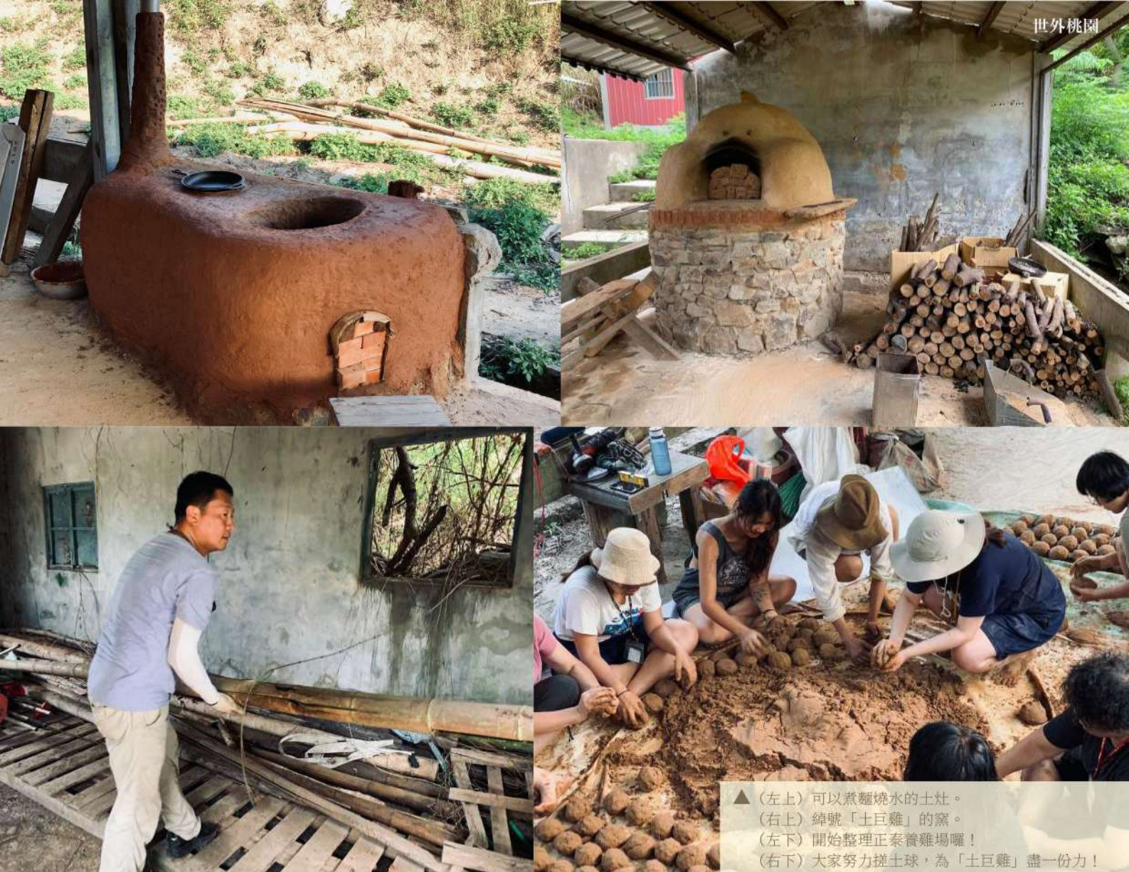
▲ (左上) 可以煮麵燒水的土灶。 (右上) 綽號「土巨雞」的窯。 (左下) 開始整理正泰養雞場囉！ (右下) 大家努力搓土球，為「土巨雞」盡一份力！