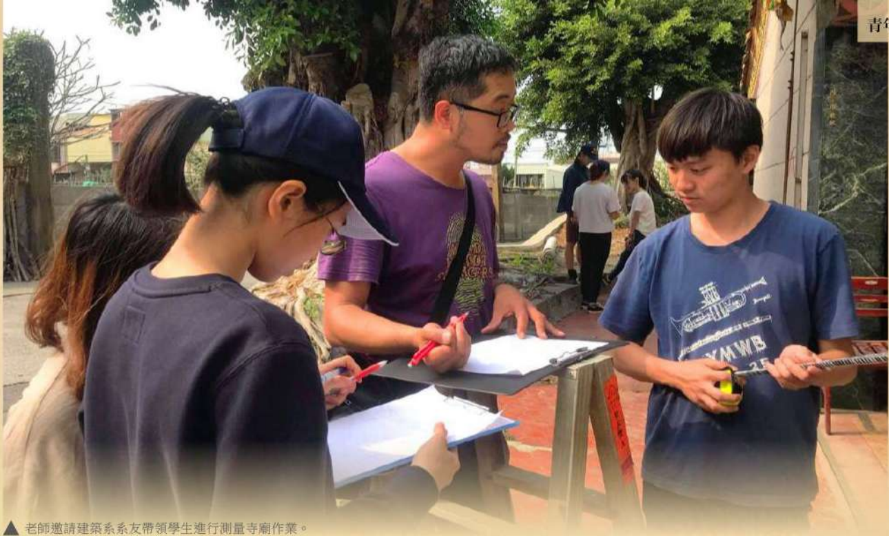
▲ 老師邀請建築系系友帶領學生進行測量寺廟作業。