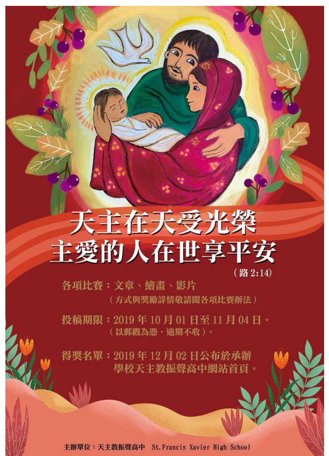
在喜樂中-各項比賽宣傳海報