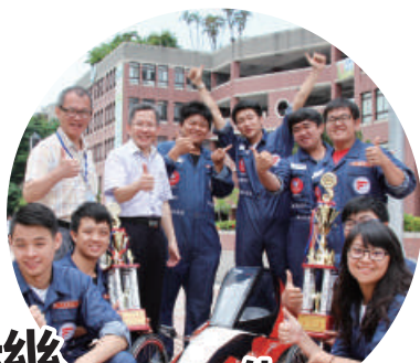
機械與自動化工程學系