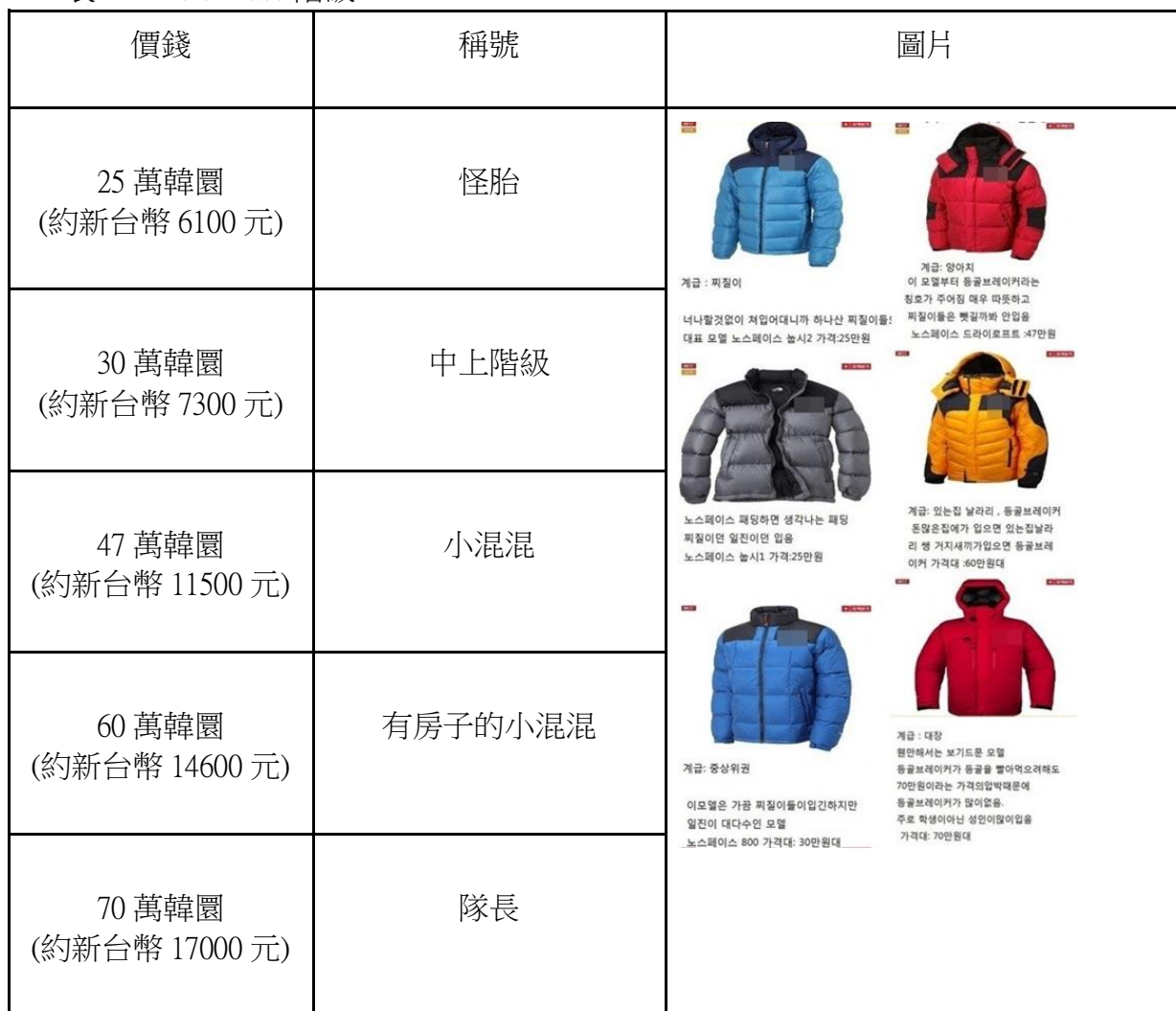
表二：North Face 階級