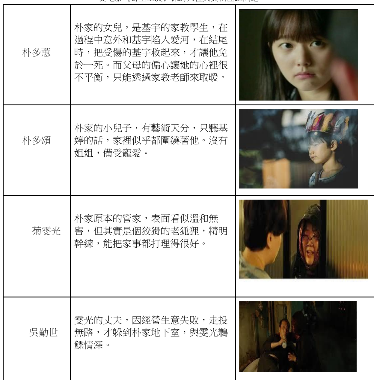
(表一資料來源：研究者整理、繪製)